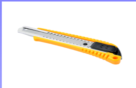
คัตเตอร์