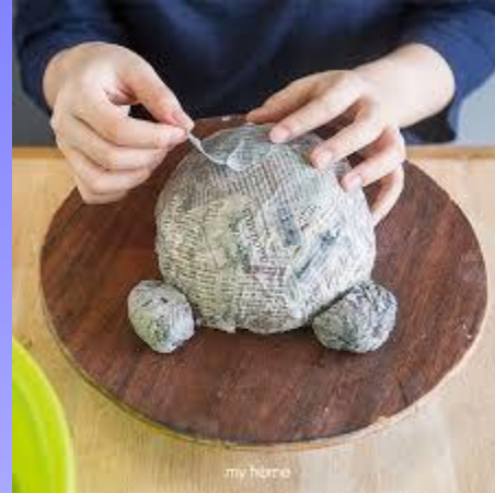
เปเปอร์มาร์เช หัวสัตว์ติดผนัง