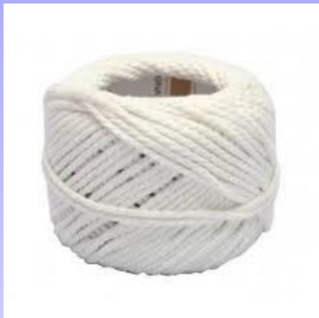
เชือก 2 เส้นละ 45 เซนติเมตร