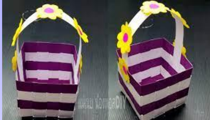
งานสานที่ทำด้วยกระดาษ