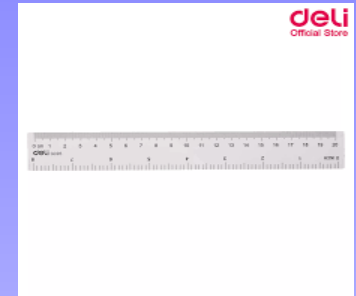
ไม้บรรทัด