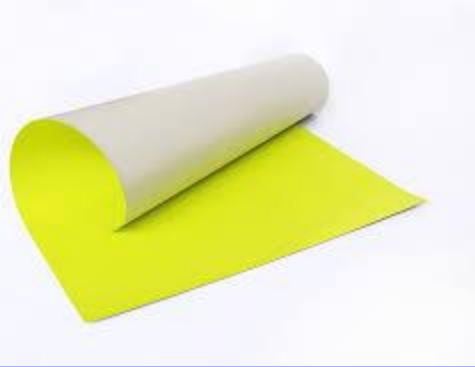
กระดาษแข็งสี