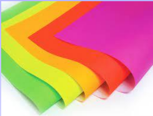
กระดาษสีต่างๆ