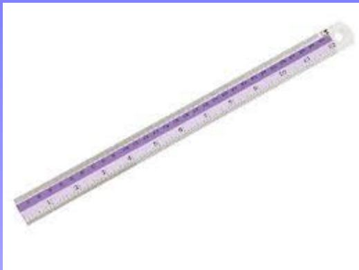
ไม้บรรทัด