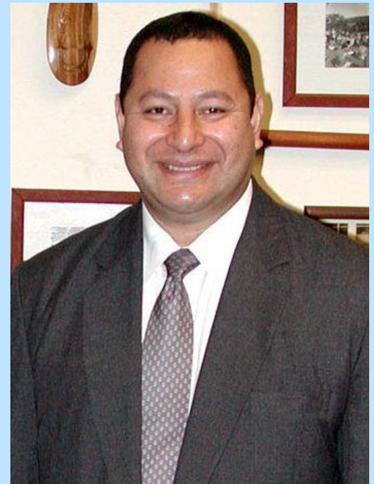
กษัตริย์ทูปูที่ 4 แห่งตองกา

และมีหนึ่งประเทศในทวีปนี้ที่ปัจจุบันมี กษัตริย์ปกครอง คือประเทศตองกา