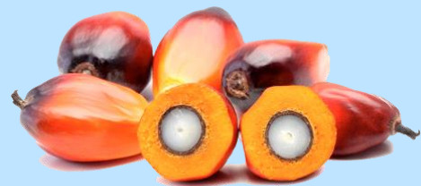
ปาล์มน้ำมัน