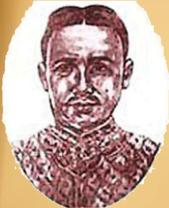
เจ้าฟ้ากุ้ง