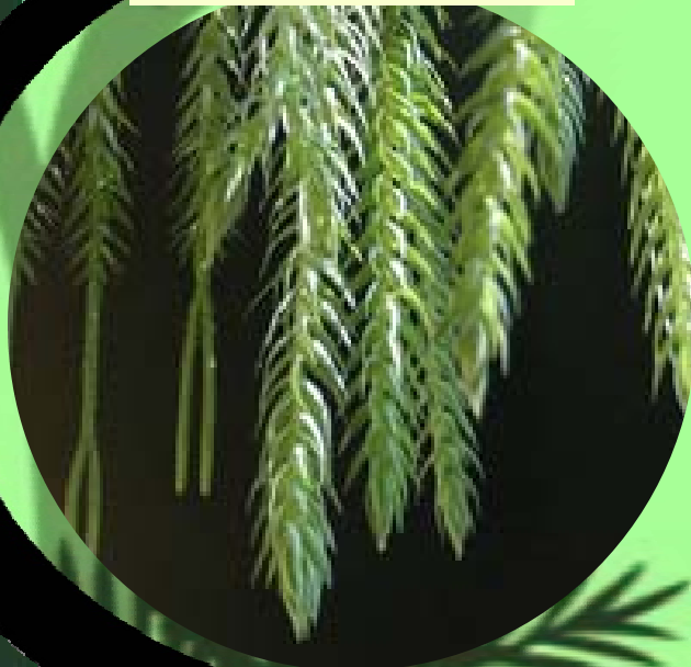
ซร้องนางคลี่