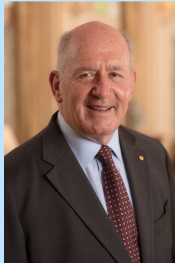
เซอร์ปีเตอร์ คอสโกรฟ