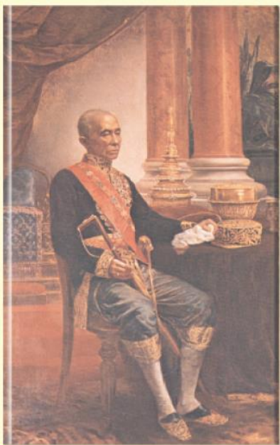
พระบาทสมเด็จพระจอมเกล้าเจ้าอยู่หัว (รัชกาลที่ ๕) (รัชกาลที่ ๔)