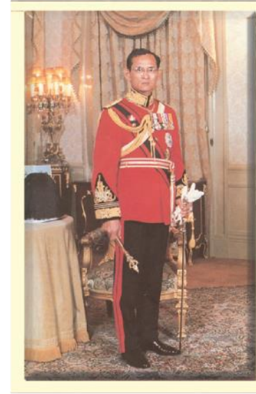
พระบาทสมเด็จพระมหาภูมิพลอดุลยเดชมหาราช บรมนาถบพิตร (รัชกาลที่ ๙)