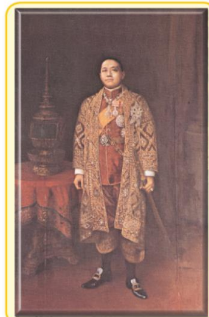
พระบาทสมเด็จพระมงกุฎเกล้าเจ้าอยู่หัว (รัชกาลที่ ๖)