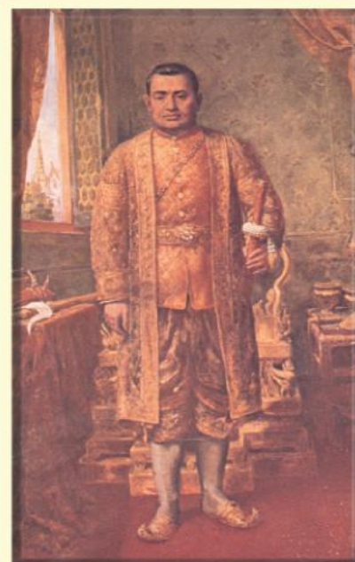
พระบาทสมเด็จพระนั่งเกล้าเจ้าอยู่หัว (รัชกาลที่ ๓)