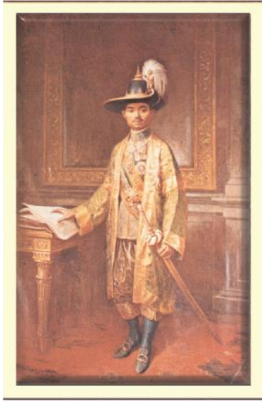
พระบาทสมเด็จพระปกเกล้าเจ้าอยู่หัว (รัชกาลที่ ๗)