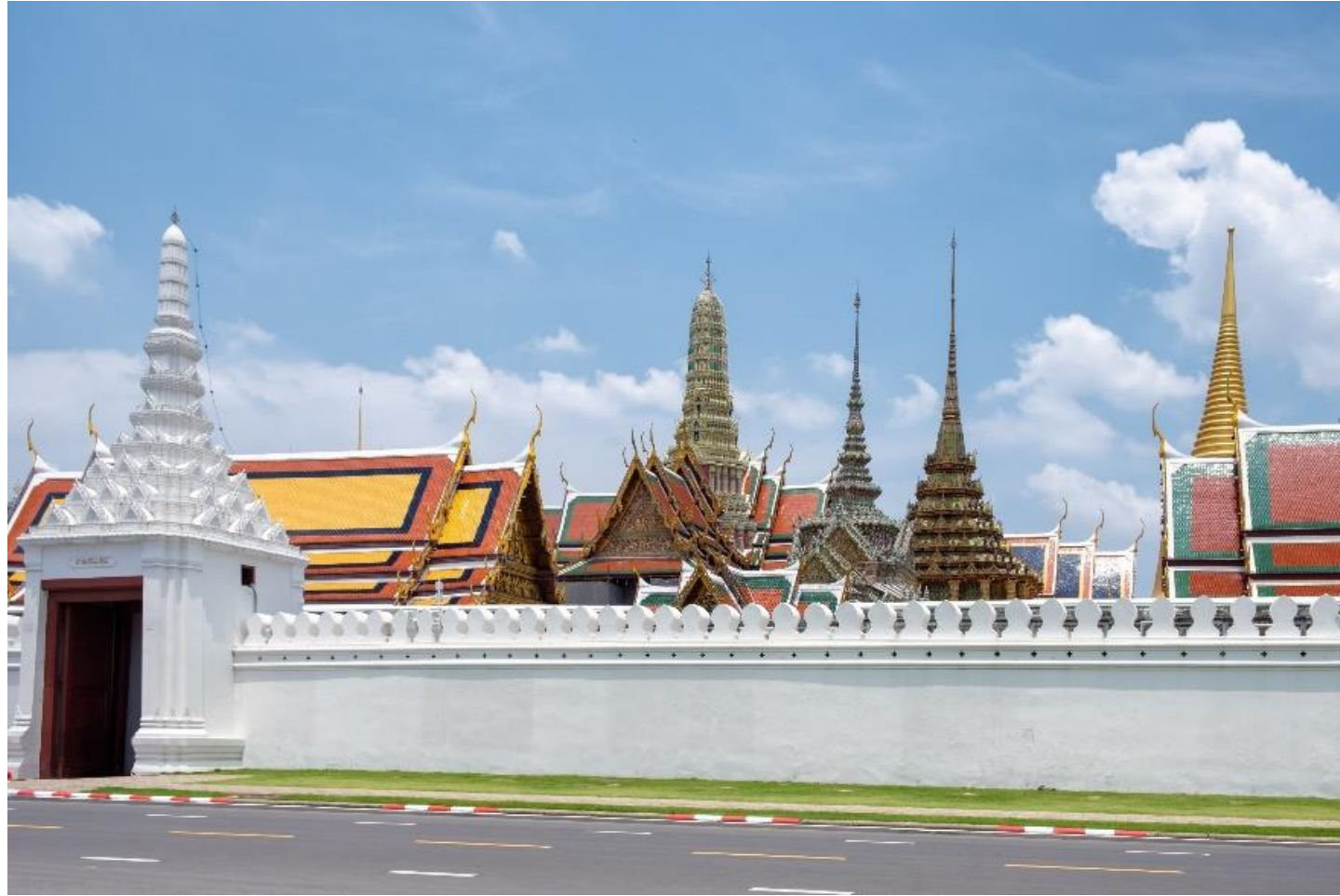
วัดพระแก้วมรกต