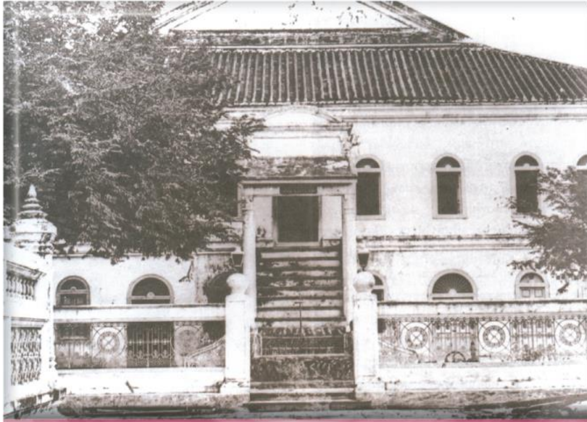
โรงกษาปณ์สิทธิการ ตั้งอยู่ในพระบรมมหาราชวัง