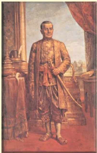
พระบาทสมเด็จพระพุทธยอดฟ้าจุฬาโลก มหาราช (รัชกาลที่ ๑)