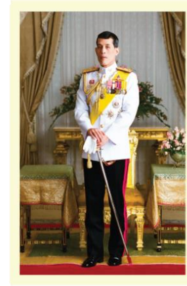
พระบาทสมเด็จพระวชิรเกล้าเจ้าอยู่หัว (รัชกาลที่ ๑๐)