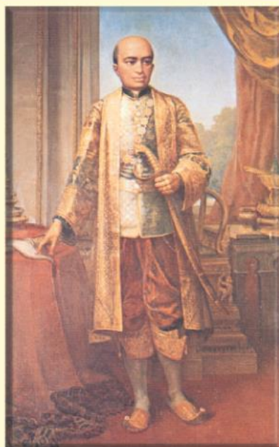
พระบาทสมเด็จพระพุทธเลิศหล้านภาลัย (รัชกาลที่ ๒)