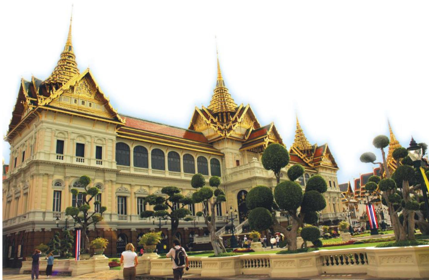
พระบรมมหาราชวัง