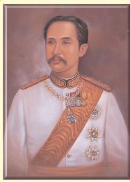
พระบาทสมเด็จพระจุลจอมเกล้าเจ้าอยู่หัว (รัชกาลที่ ๕)