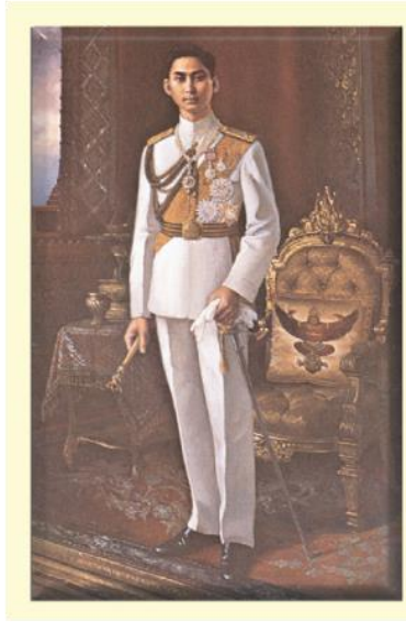
พระบาทสมเด็จพระปรเมนทรมหาอานันทมหิดล (รัชกาลที่ ๘)